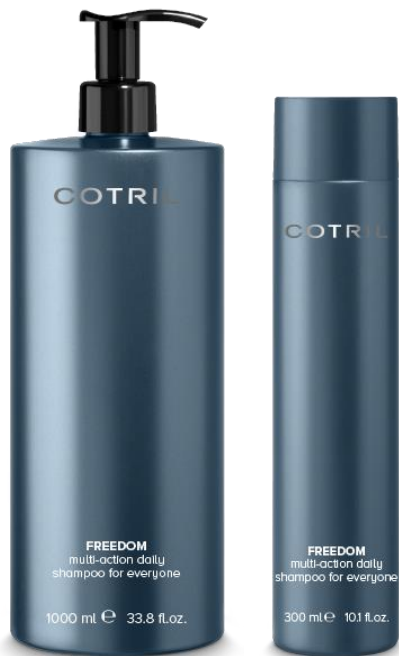
300 ml kód: 6961 1000 ml kód: 6963