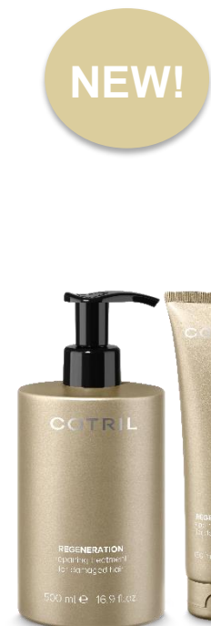
OBNOVUJÍCÍ OŠETŘENÍ PRO POŠKOZENÉ VLASY (Maska / koncentrovaná kúra)