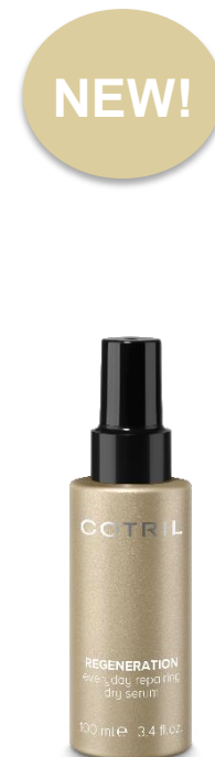
OBNOVUJÍCÍ SUCHÉ SÉRUM PRO KAŽDODENNÍ POUŽITÍ