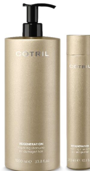
OBNOVUJÍCÍ ŠAMPON PRO POŠKOZENÉ VLASY