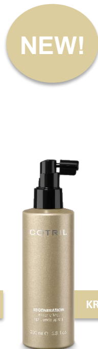
SPREJ SE ZRCADLOVÝM EFEKTEM, UZAVÍRACÍ A PROTI TŘEPENÍ KONEČKŮ