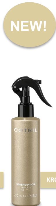
OBNOVUJÍCÍ MIST MLHA