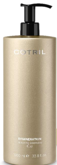
INTENZIVNÍ REGENERAČNÍ FLUID