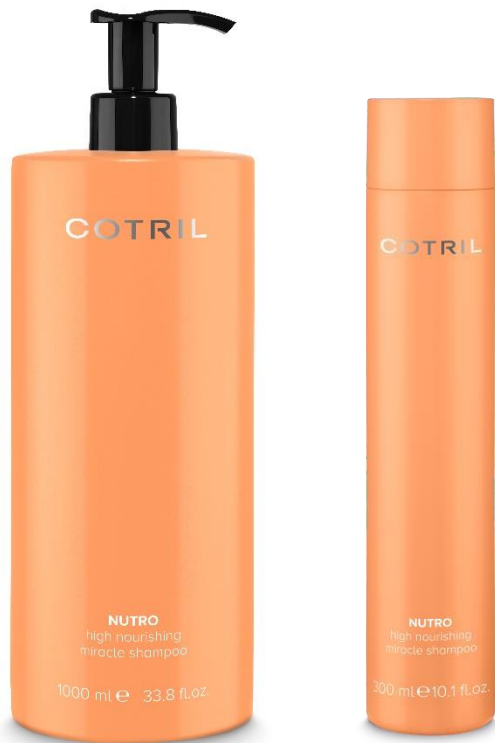
Balení: 300; 1000 ml